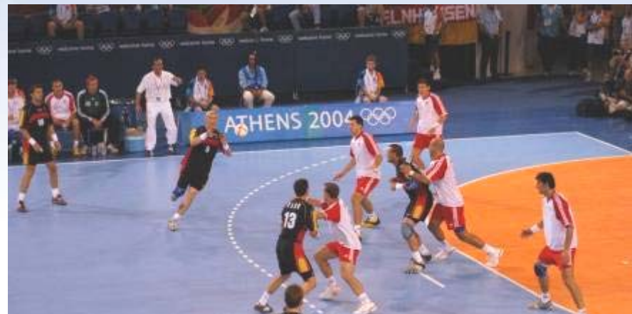
Übergang RM + Einlaufen Außen in den Rückraum