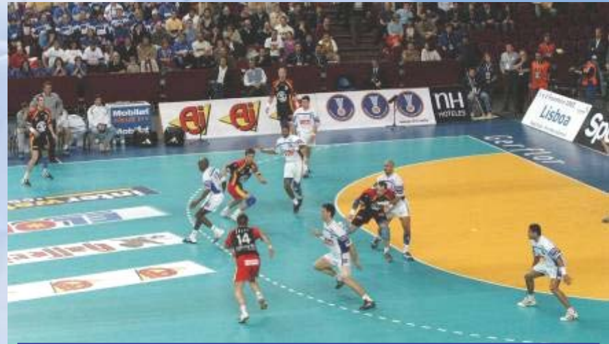
Übergang RM + Gegenziehen KM