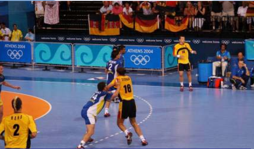
Übergang RM ohne Ball