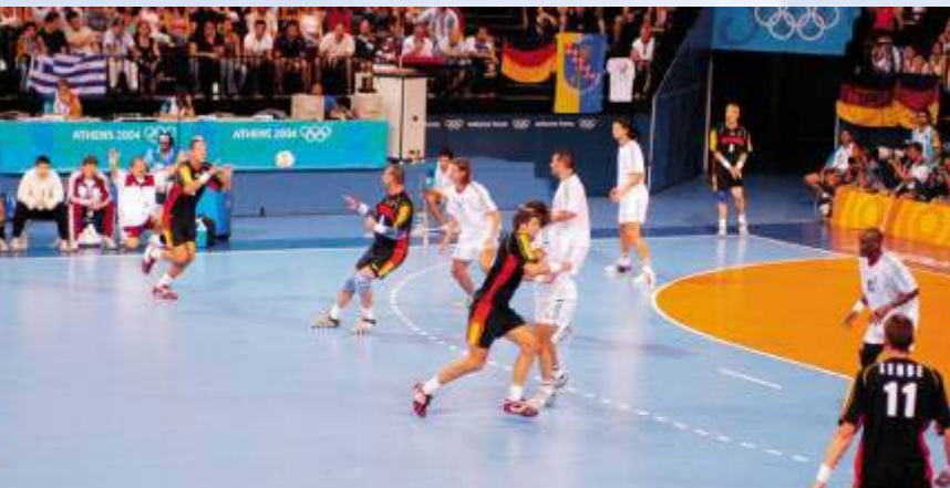
Übergang RM + Anspiel KM im Rückraum